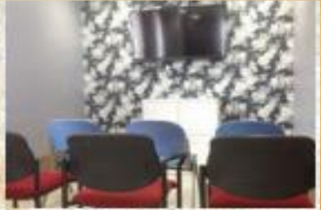
4F多目的ルームにあるカラオケ設備とシアタールーム